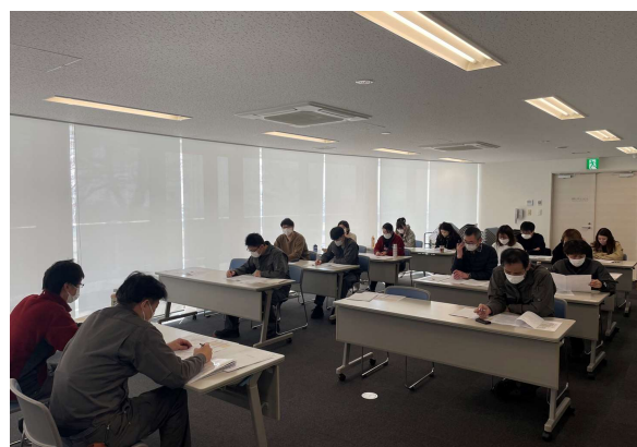
藻岩山ロープウェイの安全教育