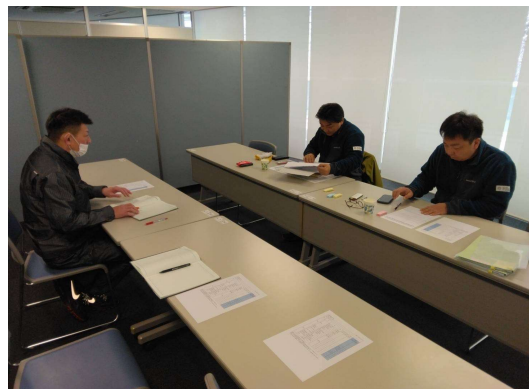
索道内部監査（藻岩山ロープウェイ）