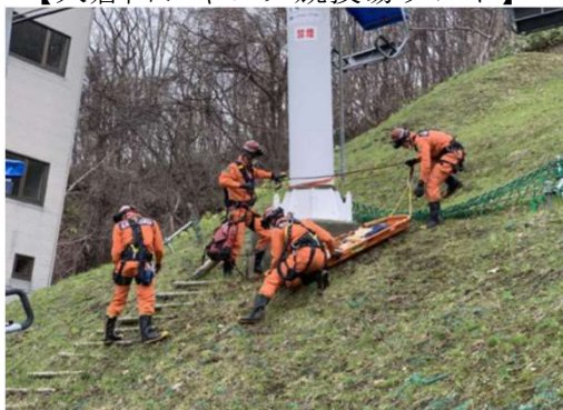
消防局との合同救助訓練