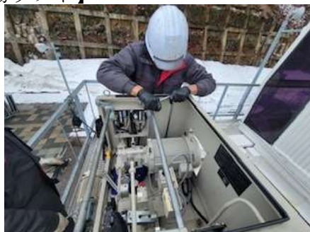
油圧緊張装置ポンプの交換