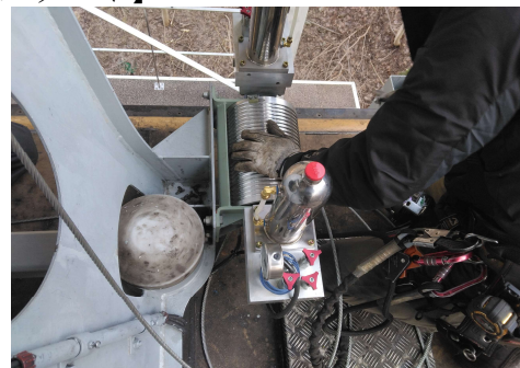
1号搬器の減衰装置の整備