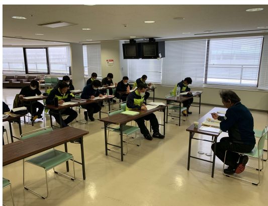
大倉山ジャンプ競技場リフトの安全教育

定期整備に伴う運休期間中に、安全管理規程・運転取扱細則・整備細則の再教育や緊急停止時に備えた救助訓練を実施し、教育終了後に効果測定の結果を踏まえて、課題や反省点などの確認を行いました。