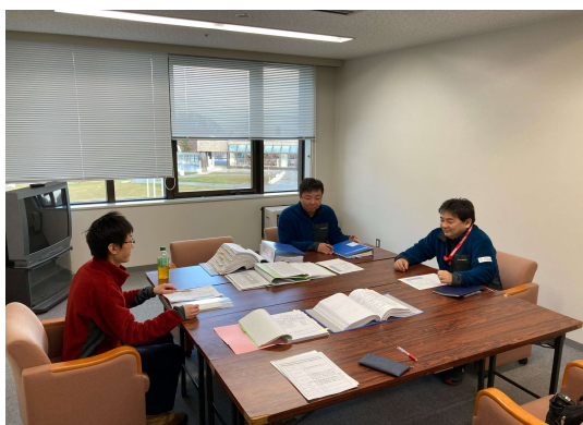
索道内部監査（大倉山リフト）

また、安全管理体制・整備の実施体制・教育訓練の状況などに関する索道内部監査を実施し、監査の結果に基づいた課題や問題点を明らかにし、速やかに改善策を講じて安全管理体制を維持しております。