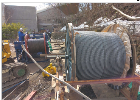
索条（えい索）の交換