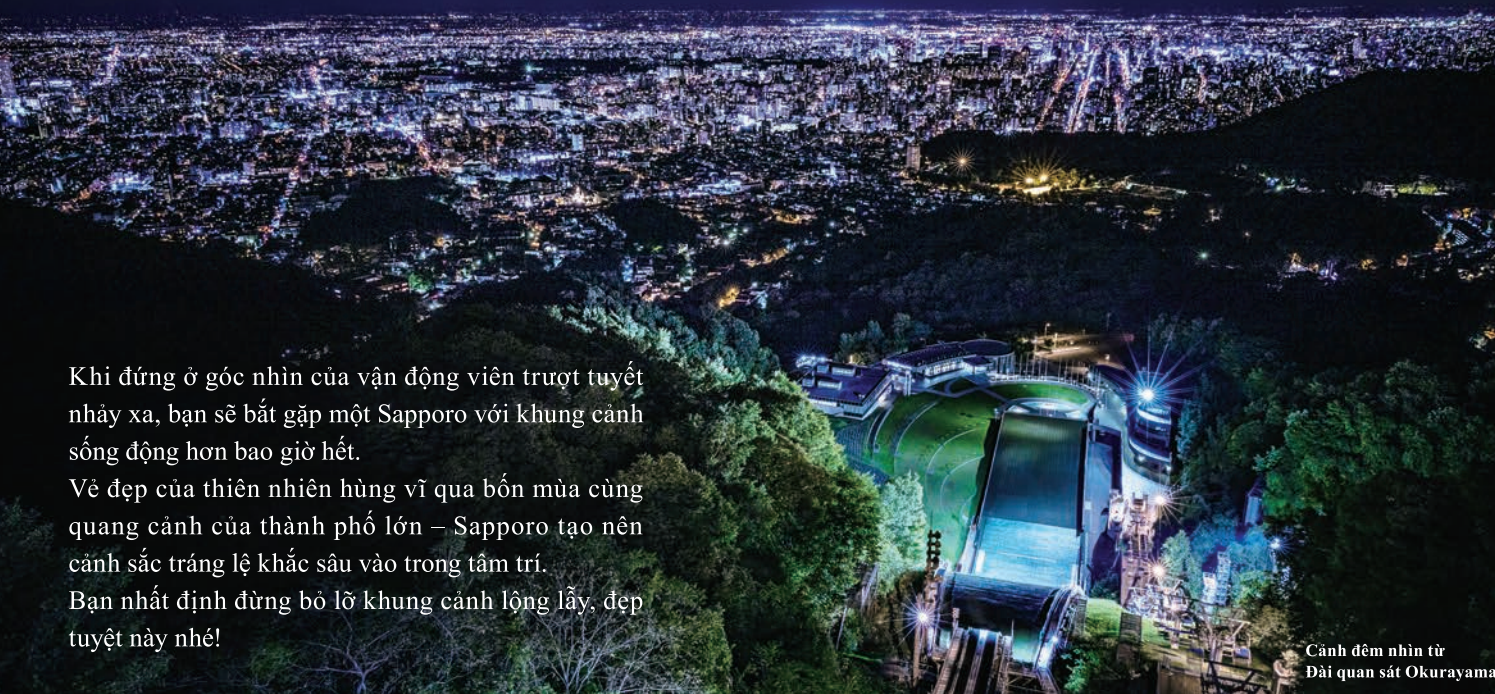
Cảnh đêm nhìn từ Đài quan sát Okurayama

Khi đứng ở góc nhìn của vận động viên trượt tuyết nhảy xa, bạn sẽ bắt gặp một Sapporo với khung cảnh sống động hơn bao giờ hết.